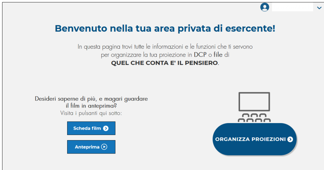
Figura 1: Anteprima dell'area privata del Portale Esercenti.

Una volta iscritto al Portale Esercenti, avrai accesso alla tua pagina privata di esercente (Figura 1), dalla quale potrai accedere alla scheda e all'anteprima del film e procedere all'organizzazione del tuo evento facendo click su " Organizza Proiezioni ". Prenotare una o più proiezioni è facilissimo: dovrai compilare un semplice modulo online e seguire le istruzioni. Questione di pochi minuti.