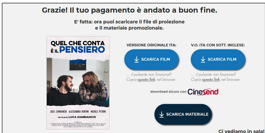
Figura 2: Anteprima della pagina di download di file e materiale di proiezione.

Dopo aver approvato la tua prenotazione entro massimo 24 ore, ti invieremo un link di pagamento sicuro (metodi di pagamento accettati: PayPal, bonifico bancario). Al termine del pagamento, verrai indirizzato alla pagina privata di download dei file di proiezione e del materiale promozionale (Figura 2). Il download avverrà tramite CineSend, piattaforma professionale usata in tutto il mondo da cinema e film festival. Fatto! Ora prova i file sul tuo sistema di proiezione e prepara la sala!